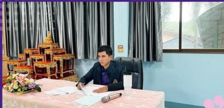
ประชุมครูและบุคลากรทางการศึกษา ประจำเดือน มิถุนายน